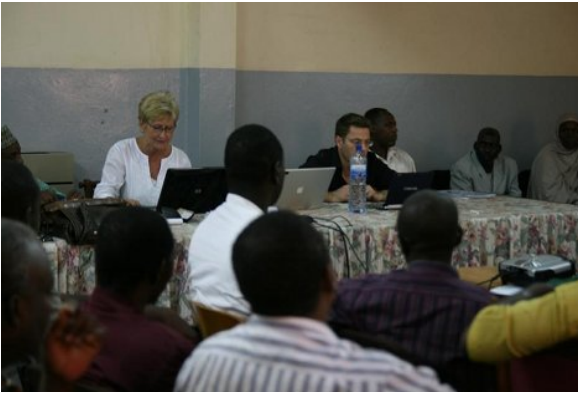
Séance de restitution des travaux sur le terrain avec des chercheurs de la CUDC

Un mandat. La République du Niger a sollicité l'expertise des chercheurs de la Chaire UNESCO de Développement curriculaire (CUDC) de l'Université du Québec à Montréal (UQAM). Ces chercheurs ont reçu le mandat d'appuyer la Direction des curricula et de l'Innovation pédagogique du Ministère de l'Éducation du Niger dans sa démarche de réforme de l'éducation de base et de l'éducation non formelle. Ce vaste processus a pris une forme particulière. Le choix a été fait de responsabiliser les partenaires locaux afin de réfléchir à un modèle nigérien plutôt que d'importer des modèles éprouvés dans d'autres pays.