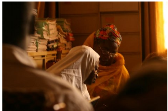
D'entrée de jeu, les femmes nigériennes ont pris une part très active dans ce projet

Une banque de situations. Sur la base des résultats de l'enquête, mais aussi des exigences des standards internationaux, une banque de situations a été construite. Toutes ces situations sont bâties sur la base des réalités nigériennes, culturelles, sociales et économiques. Des exemples de situations sont suggérés dans cette banque. Ces exemples sont regroupés par familles de situations.